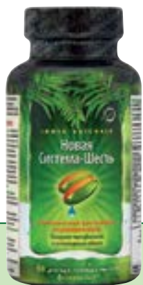
90 мягких гелевых капсул Quicksorb Gels™

Научно обоснованный и отлично зарекомендовавший себя в клинической практике комплекс для очищения, восстановления и поддержания работы печени и желчевыводящих путей при самых разнообразных нарушениях, включая вирусные и алкогольные гепатиты.