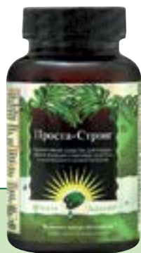
90 мягких гелевых капсул Quicksorb Gels™

Эта наиболее полная научно обоснованная формула содержит самые эффективные на сегодняшний день компоненты, предназначенные для решения практически любых проблем с предстательной железой.