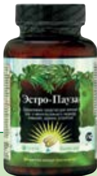
80 мягких гелевых капсул Quicksorb Gels™

Эстро-Пауза помогает сделать перестройку организма более плавной, снять или облегчить симптомы климакса, укрепить костную ткань и избежать остеопороза, сердечно-сосудистых заболеваний и раннего старения женского организма.