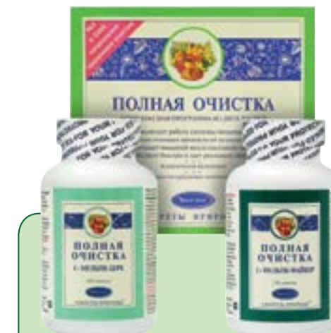
120 + 120 таблеток