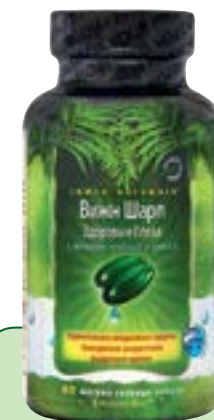
60 мягких гелевых капсул Quicksorb Gels™