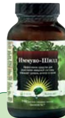
100 мягких гелевых капсул Quicksorb Gels™