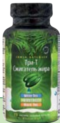
75 мягких гелевых капсул Quicksorb Gels™

ТРИ-Т Сжигатель жира – это препарат для необычного способа снижения веса именно за счёт лишних жировых отложений с помощью трёх видов чая, эффективной комбинации жиросжигающих ингредиентов с супервысокой антиоксидантной защитой.